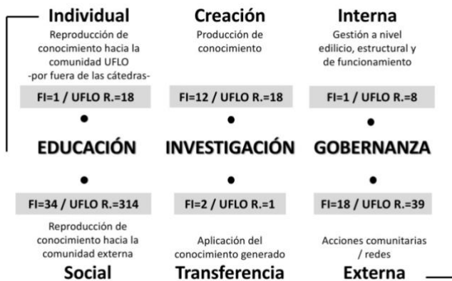
Figura 1: Categorías y subcategorías de Educación, Investigación y Gobernanza consideradas según Sedlacek (2013).

A fines comparativos, se calcularon los siguientes indicadores: