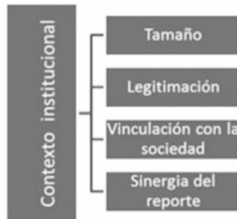
Figura 6: Modelo explicativo del accionar en pos de los Objetivos de Desarrollo Sostenible.

necesidad de vincularse con la sociedad [23] (Fig.6).