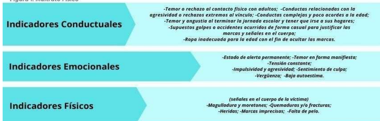
Figura 1: Maltrato Físico