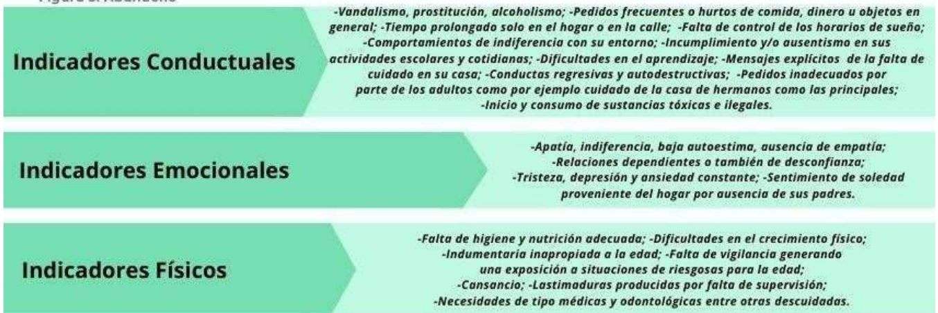
Figura 3: Abandono