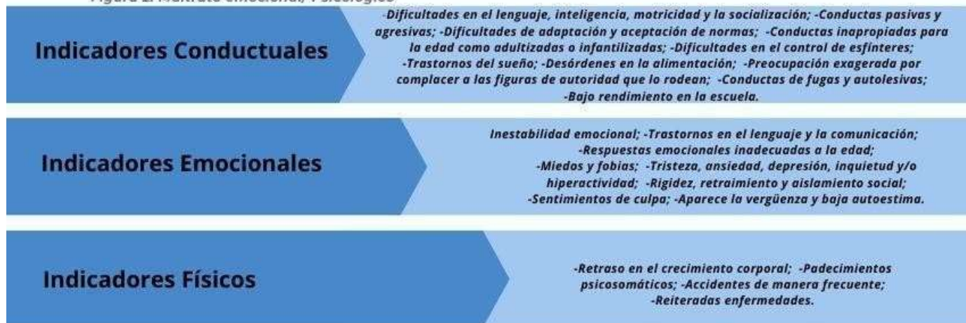
Figura 2: Maltrato emocional/ Psicológico