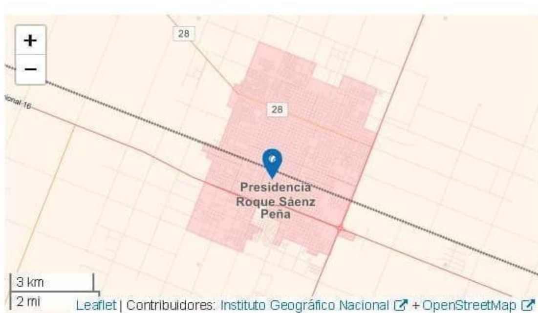
Gráfico 1: localización de la localidad Presidencia Roque Sáenz Peña

En este espacio geográfico se ubica la localidad objeto de este análisis. Presidencia Roque Sáenz Peña es la segunda localidad más poblada de la provincia y es la cabecera del departamento Comandante Fernández. El municipio fue creado en el año 1912, tiene 41,79 km 2 de superficie y, según datos del último Censo de población, el departamento tiene 102.086 habitantes (INDEC, 2023).