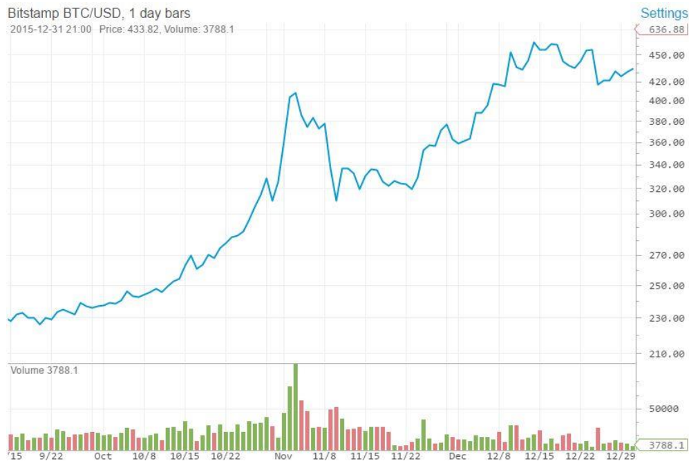
Ilustración 5 - Cotización bitcoin al 31.12.2015