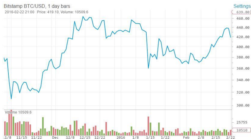
Ilustración 10 - Cotización del bitcoin al 22.02.2016 - Fuente: https://markets.blockchain.info/