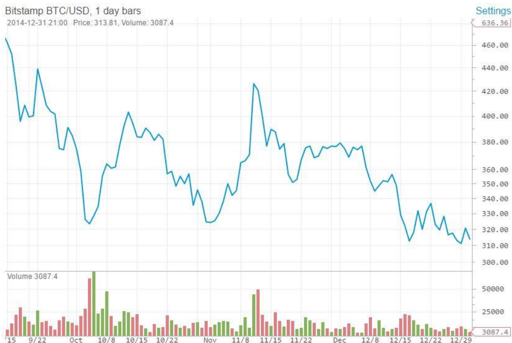
Ilustración 2 - Cotización bitcoin al 31.12.2014 - Fuente: https://markets.blockchain.info/