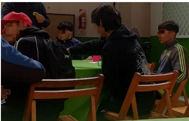
Imagen 5: Adolescentes compartiendo una merienda en el centro socioeducativo.