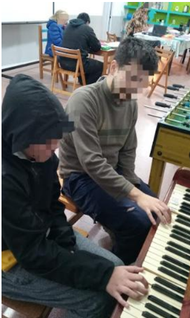
Imagen 4: Adolescentes participando del taller de música.