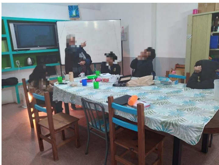
Imagen 2: Adolescentes participando de un debate grupal junto a una docente.