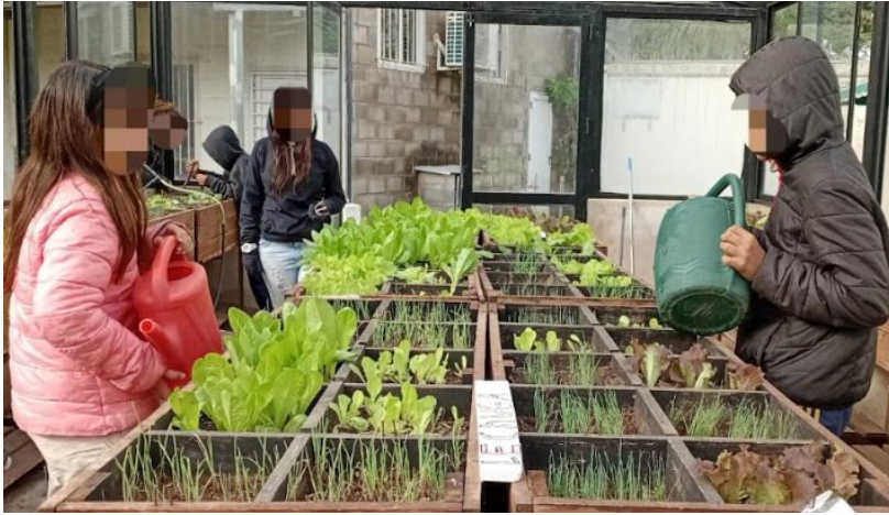
Imagen 3: Adolescentes realizando actividades en la huerta comunitaria.