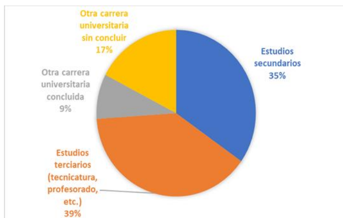
Figura 3 Formación previa

Acerca de la trayectoria educativa previa, el 39,1% de las encuestadas tiene estudios terciarios, lo que sugiere una preparación educativa adicional antes de iniciar su carrera actual. Además, el 34,8% tiene estudios secundarios como su nivel educativo más alto, el 17,4% tiene otra carrera universitaria sin concluir y un 8,7% tiene otra carrera universitaria concluida.