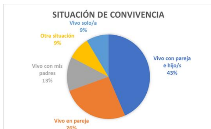
Figura 2 Situación de convivencia

En cuanto a la situación familiar, la mayoría vive en pareja o en familia.